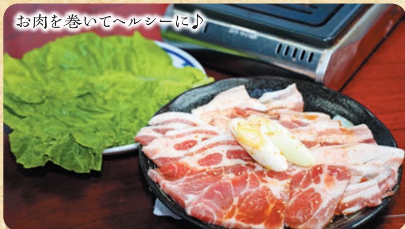
お肉を巻いてヘルシーに♪